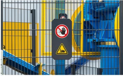
Tavola di concordanza estesa RESS Direttiva / Reg. Macchine